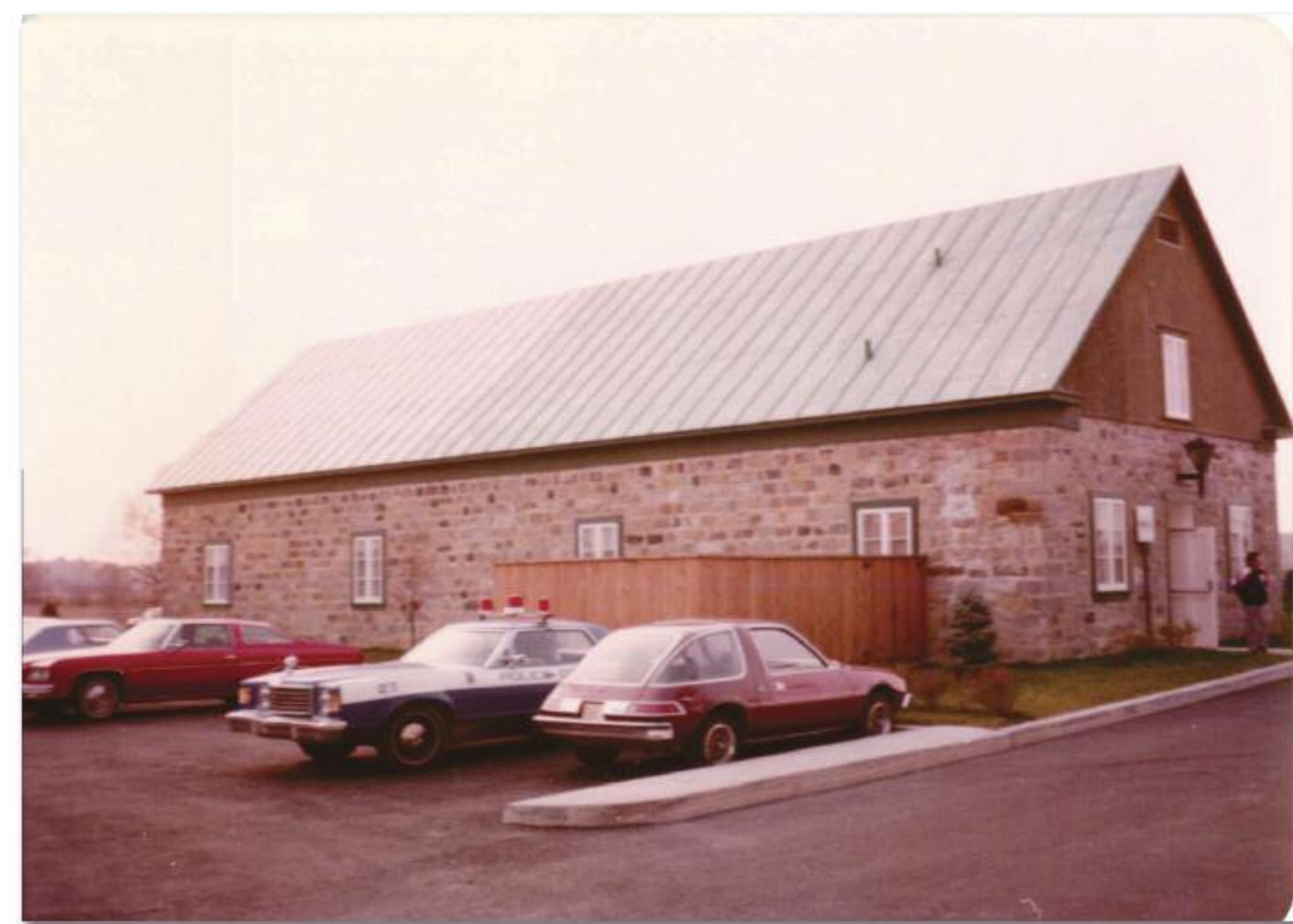
La nouvelle salle du conseil le jour de l'inauguration du nouvel hôtel de ville

La cour municipale qui a compétence en matière criminelle, pénale et civile va y siéger également. La salle du conseil de ville est également un lieu privilégié pour tenir diverses assemblées de citoyens, des réceptions, des conférences de presse et des expositions diverses. Par exemple, à l'automne 1989, le Comité Georges – Delfosse, a inauguré le premier Festival de peinture de Mascouche et on y a exposé annuellement les toiles d'artistes invités jusqu'en 2008.