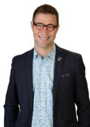
Guillaume Tremblay Maire de Mascouche

Merci à l’ensemble des partenaires, citoyens et intervenants municipaux qui ont participé à l’élaboration de cette politique. La mobilisation de tous demeure la clé du succès!