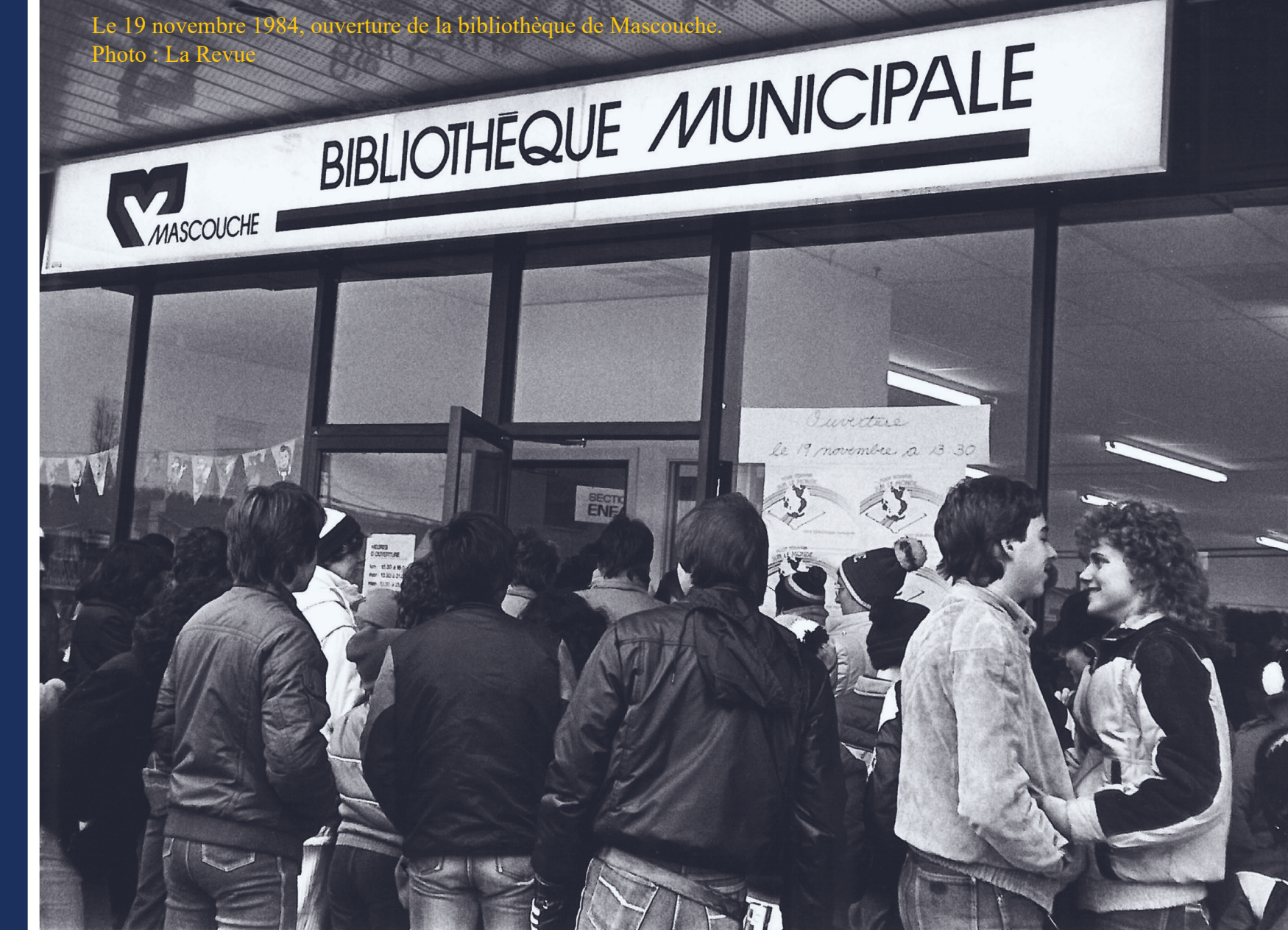
Le 19 novembre 1984, ouverture de la bibliothèque de Mascouche.

Le 31 août 2015, la Ville de Mascouche nomme officiellement la bibliothèque municipale Bernard-Patenaude en reconnaissance d'un héritage politique et de dévotion d'un maire pour sa ville, mais aussi d'un homme qui aimait profondément les livres.